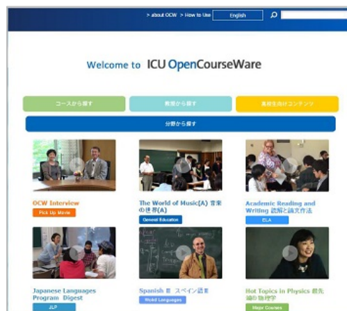
(現在の ICU OpenCourseWare トップページ)

この 3 年間で収録にご協力頂いた先生方は約 100 人、まず ICU の特徴ある授業ということで、「一般教育 (GE)」担当の先生 (主に専任教員) にご協力を頂き、6 割以上の授業を収録することができました。多くの先生方のご協力とご支援に感謝します。