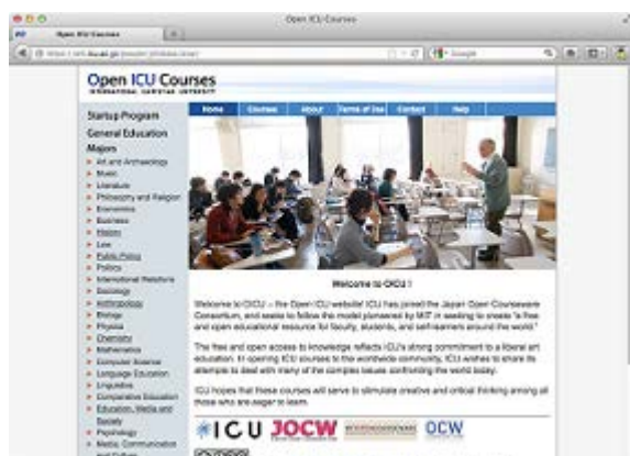
(Open ICU Courses トップページ)

コンテンツはメジャー科目 (8 コース)、入学前教育プログラム等で、講義シラバス、レクチャーノートなどがメイン。