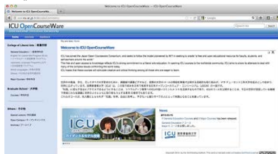
(当初の ICU OCW トップページ)

ICU OCW サイト ( http://ocw.icu.ac.jp ) が正式公開。4 月の公開コンテンツは GE 科目 8、メジャー科目 7、大学院科目 1、その他特別講義、オープンキャンパスモデル授業 13 で、合計 29 コンテンツ。